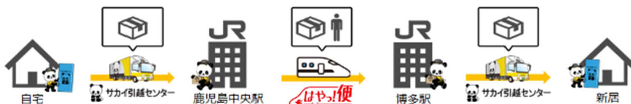
《新プラン「九州新幹線 de 即日引越」輸送イメージ》